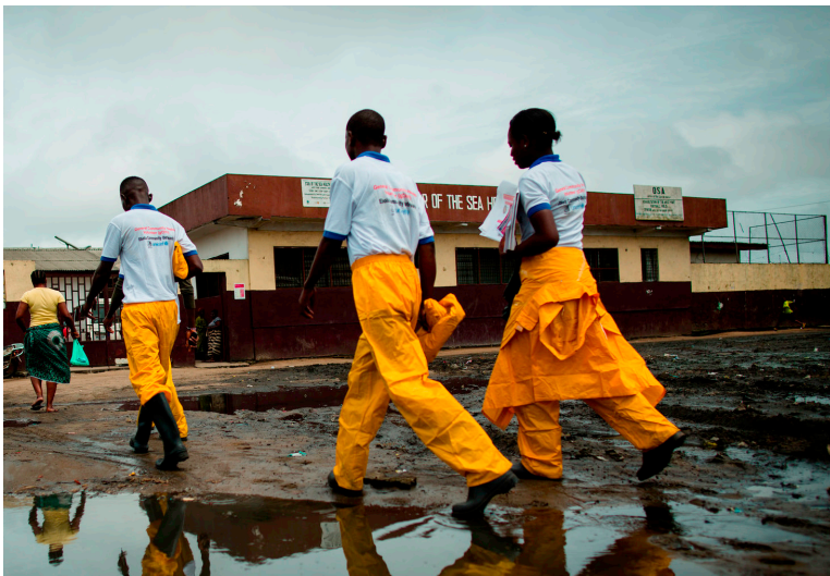
Personnel d'intervention à Monrovia (Libéria).

Les effets du virus se feront sentir bien après qu'il sera maîtrisé et il pourrait affecter des millions de personnes parmi les plus pauvres et les plus vulnérables, plus particulièrement les femmes et les jeunes.