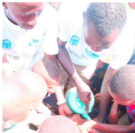
Démonstration des bonnes pratiques d'hygiène par de jeunes volontaires à Conakry (Guinée).

Le PNUD appuiera des formations destinées aux chefs religieux, aux enseignants, aux représentants de la jeunesse et aux mobilisateurs communautaires sur la sensibilisation et les messages à transmettre concernant le traitement et la prévention d'Ebola, et contribuera à promouvoir des comportements responsables, à dissiper les rumeurs et à réduire la stigmatisation.